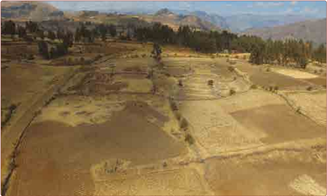
Figura 2. En primer plano el centro ceremonial de Campanayuc Rumi, al fondo el cerro Pilluchu (Foto PIA CQR-2016).

quechua, con tierras propicias para el cultivo del maíz, y la región suni, con tierras adecuadas para el cultivo de productos altoandinos como la oca, maswa , olluco, papa, quinua, así como el pastoreo de camélidos. Asimismo, esta ubicación permite el rápido acceso a los territorios de la puna y a las tierras cálidas del valle del río Pampas.