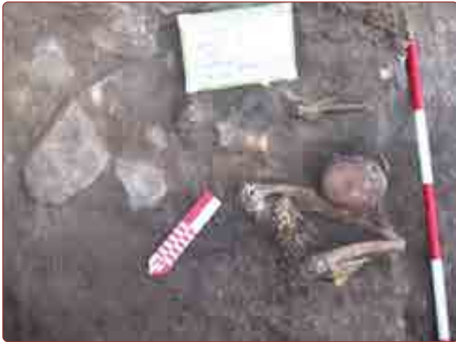
Figura 6. Contexto Funerario 18.

Como elementos asociados se encontraron huesos de camélidos, asta de venado, cerámica fragmentada, un fragmento de figurina con imagen de un camélido, un artefacto lítico con restos de cinabrio. También es notoria la presencia de evidencias de actividad de quema en el hoyo.