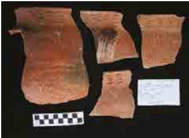
Figura 8. Cerámica asociada a Contexto 12.