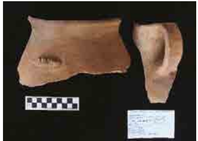
Figura 9. Cerámica asociada a Contexto CRC1-1.

y cérvidos, preferentemente de individuos tiernos y jóvenes, además de cuyes y aves, cuyas carnes seguramente fueron cocidas para ser consumidas como parte de un festín, en tanto que otros fueron depositados en calidad de ofrendas rituales. Los restos óseos recuperados presentan colores variados debido a la acción del fuego; además, hemos identificado diversos grados de fractura, así como huellas de cortes con artefactos líticos. Las características descritas corresponden a una cadena o secuencia de acciones que involucra el corte, trozado, cocción, consumo de carne y descarte de los huesos in situ ; mientras que otras cantidades o trozos de carne fueron parte de los paquetes rituales u ofrendas (Matsumoto y Cavero, 2016; Cavero et al., 2019; Cavero, 2020).