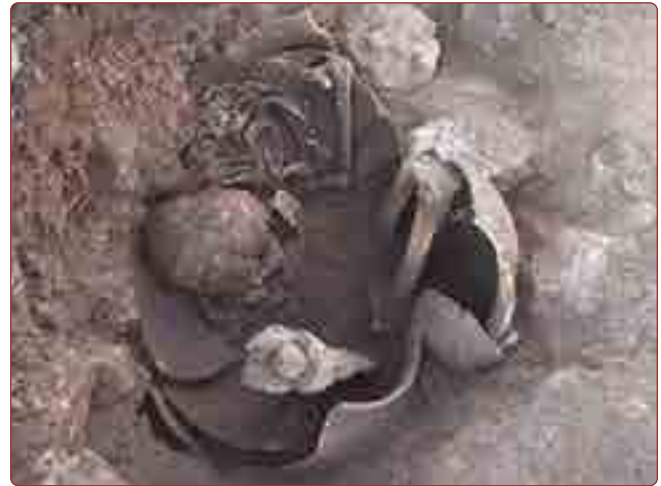
Figura 7. Contexto Funerario RC1-1.

Contexto 23: solamente se halló un ilion perteneciente a un feto de 37 semanas de gestación intrauterina. Como elementos asociados se recuperaron una escápula y una costilla de un feto de camélido, además de fragmentos de cerámica, artefactos líticos, una punta de obsidiana, una rueca de cerámica, huesos de camélidos y una aguja de hueso. También se identificaron huellas de quema.