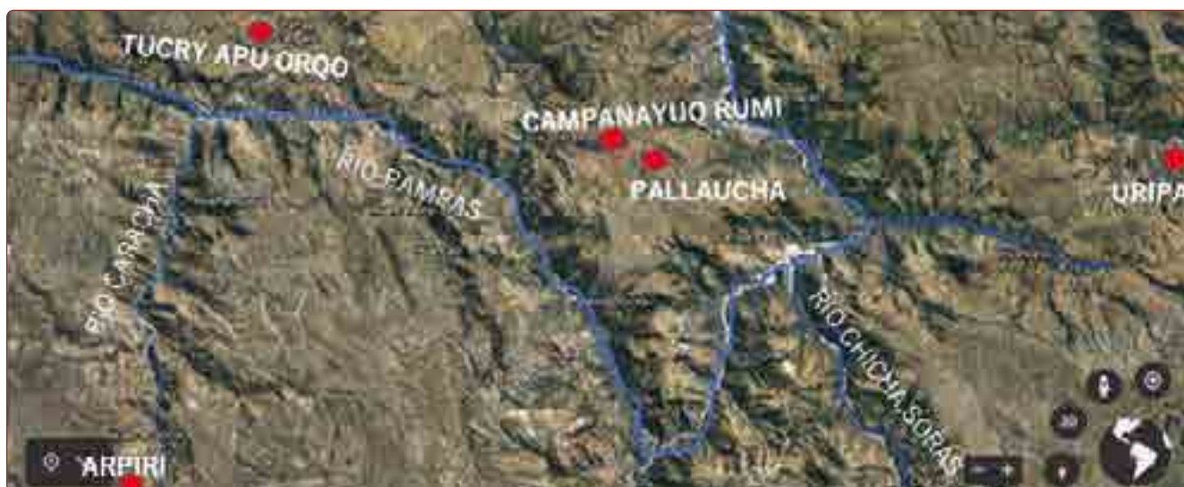
Figura 1. Mapa de ubicación del centro ceremonial de Campanayuq Rumi en la cuenca del río Pampas. (Modificado de Google Earth).

El centro ceremonial fue construido en terrenos ubicados estratégicamente en el límite natural entre la región