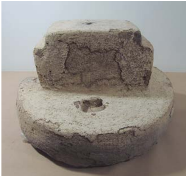
Fig. 4. Maqueta de arquitectura monumental.

Posteriormente encontramos otros doce hoyos semejantes. Aunque no hallamos contextos funerarios complejos como los anteriores, encontramos vasijas intencionalmente destruidas o cráneos humanos. Nos preguntamos por qué la mayoría de los huesos hallados son parte de cráneos y qué significado tienen las vasijas intencionalmente destruidas. Además, por qué estos contextos funerarios se hallan dentro de una estructura circular de 5 m de diámetro. Esta estructura circular, así como los hoyos con entierros de cráneos y la maqueta corresponden a la fase Campanayuc II. Creemos que este espacio arquitectónico fue dedicado a la práctica de rituales relacionados con los enterramientos de cabezas humanas.