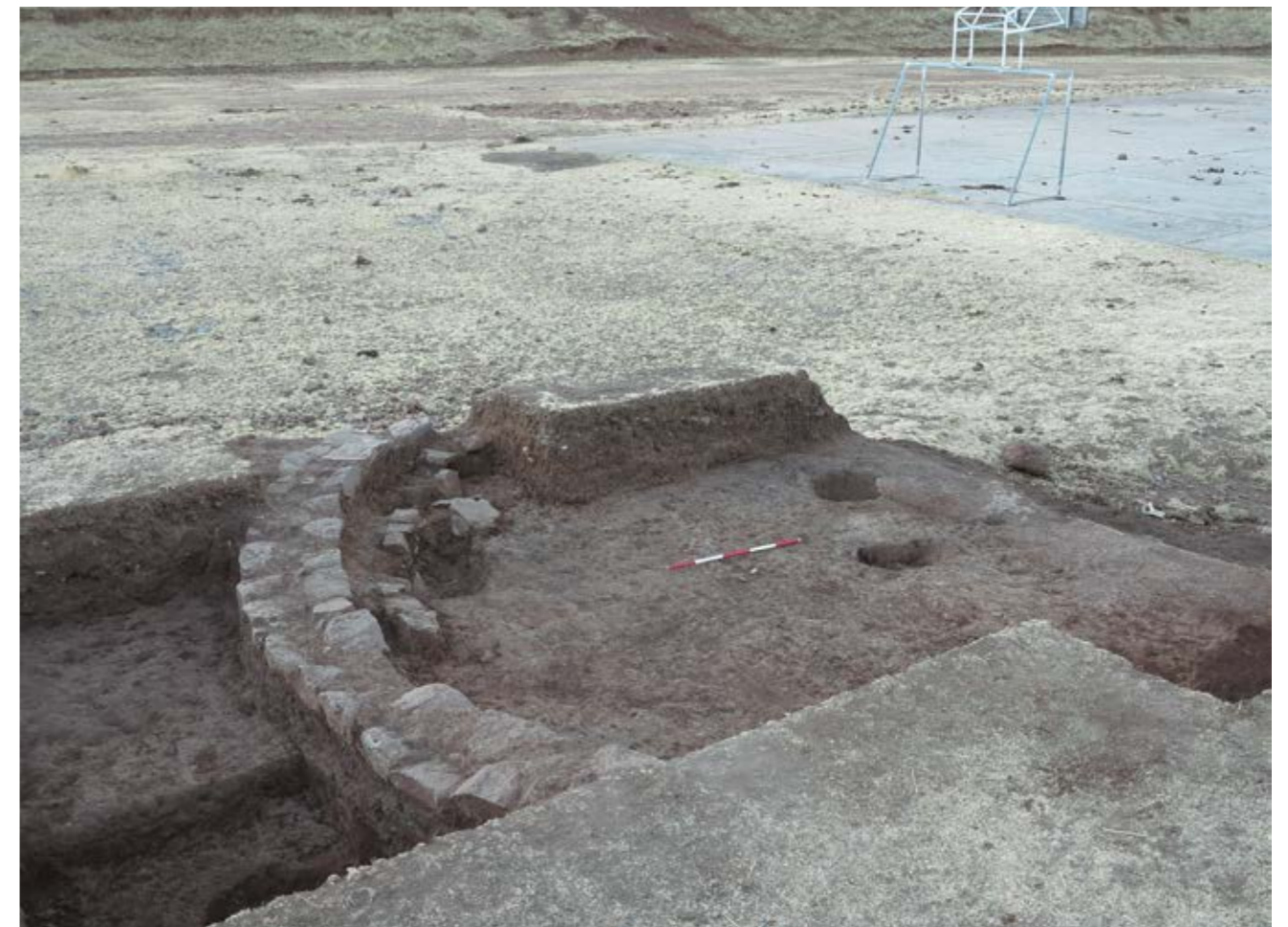
Fig. 5. Arquitectura en sector norte.

En todo caso, el siguiente paso que tomaremos será el desarrollo de una investigación más amplia en estos sectores enfocada en la identificación de las relaciones entre la arquitectura residencial y los espacios rituales hallados en las excavaciones del 2013.