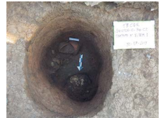
Fig. 3. Hoyo pequeño con un cráneo y cuatro cuencos.

que representa la arquitectura monumental del centro ceremonial de Campanayúq Rumi. El objeto estaba relleno de tierra fina. Al zarandearla, hallamos fragmentos de hojas delgadas de oro que eran parte de una orejera.