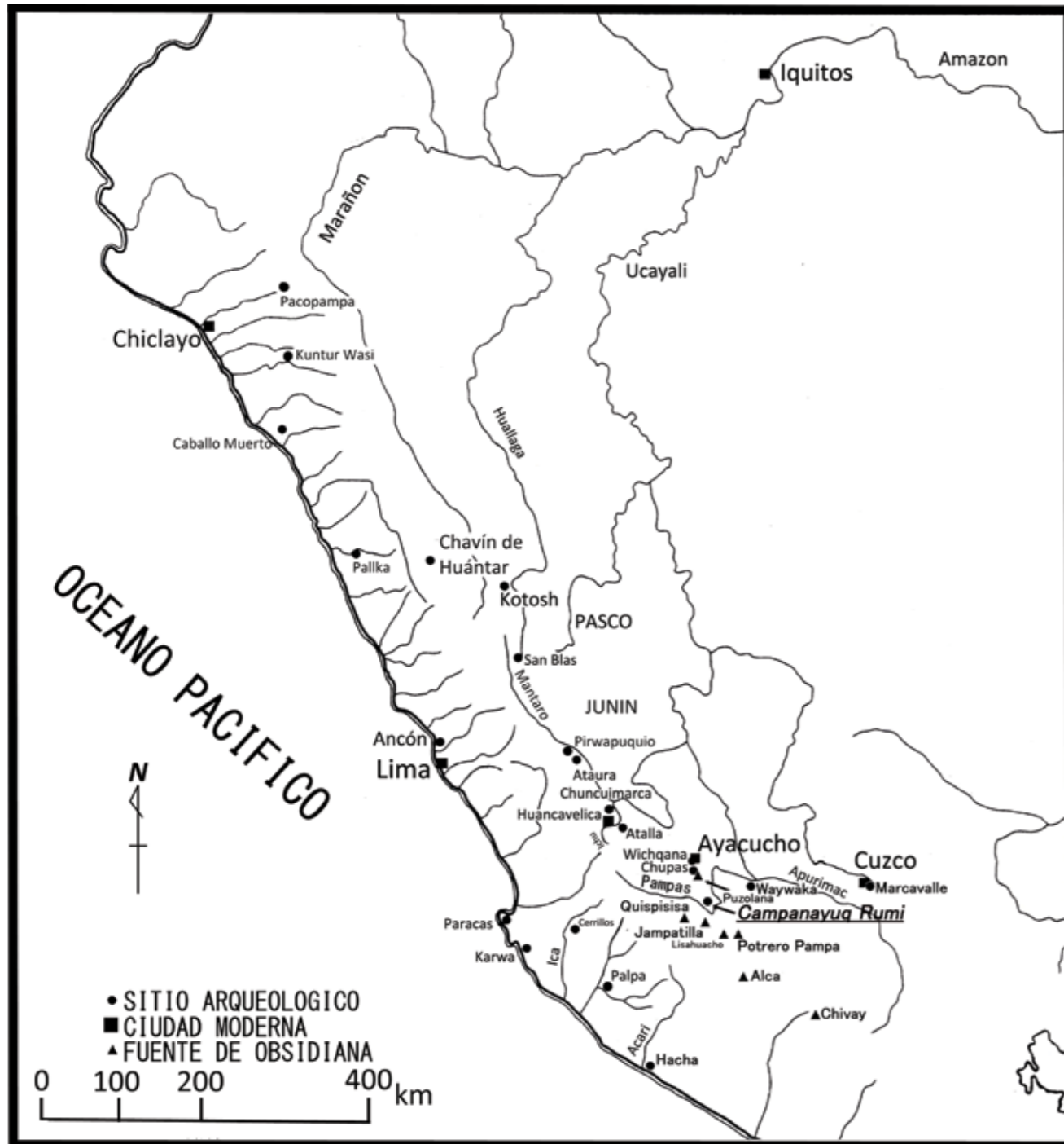
Fig. 1. Mapa con la ubicación de Campanayúq Rumi y otros sitios del Periodo Formativo de Burger y Matos (2002) modificado y redibujado por Yuichi Matsumoto.

de arquitectura doméstica y algunos restos vinculados a actividades cotidianas. Esto planteó la necesidad de tener un mejor entendimiento de las actividades de vida cotidiana desarrolladas en el sitio. Por este motivo, nuestra idea era excavar seis unidades aisladas en los sectores norte y sur; sin embargo, los nuevos hallazgos nos llevaron a ampliar las excavaciones en ambos sectores.