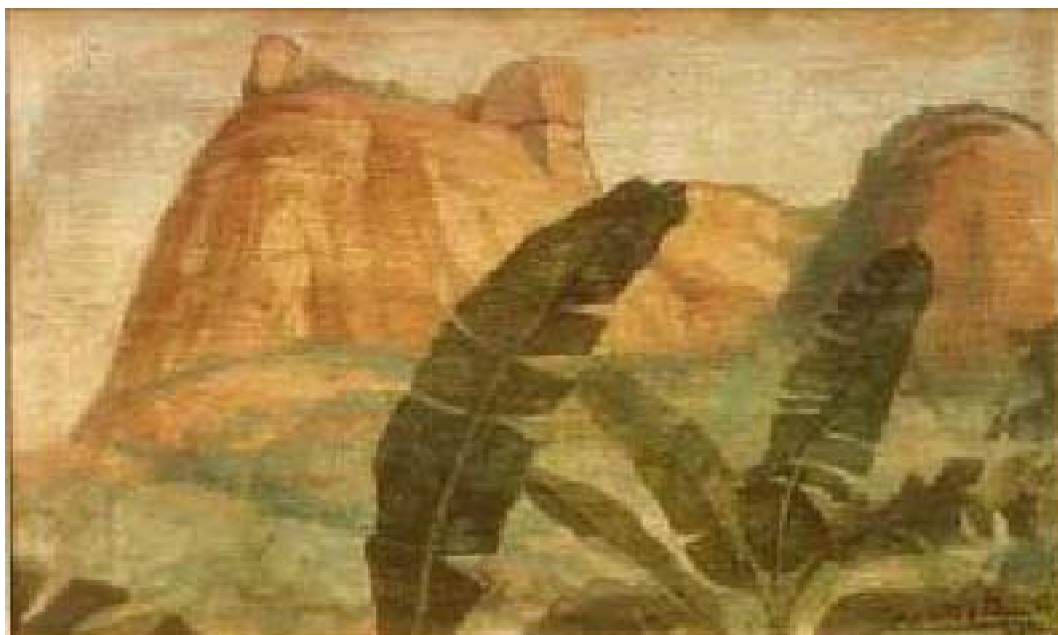
13. Bajada en barranco , c. 1940. Óleo sobre lienzo, 27 x 44 cm. Colección privada. Lima

efectos climáticos y el silencioso discurrir de los ríos iluminados por una radiante luz, fueron los preferidos del pintor loreitano.