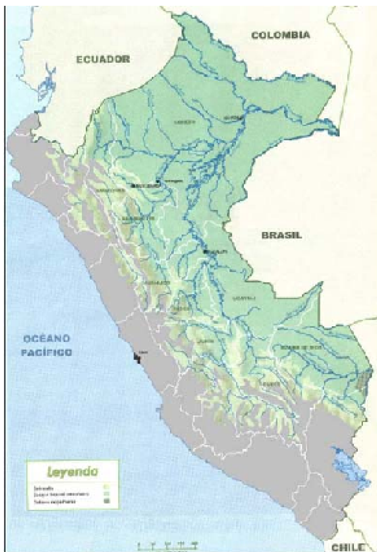
FIGURA N° 1. Selva alta y baja del Perú. Tomado de Enciclopedia Ilustrada del Perú de A. Tauro del Pino corregido para este estudio.

especies de plantas superiores, 2,500 especies de artrópodos, 2,500 de peces y 300 especies de mamíferos 2 . La amplia red hidrográfica que cruza sus bosques, que constituye no solamente fuente de recursos para los habitantes sino también vías de tránsito, han dificultado la implementación de caminos para su exploración en los tiempos modernos. Algunos de los más importantes ríos son el Marañón y el Ucayali que forman el Amazonas, el más caudaloso que atraviesa buena parte de Sudamérica.