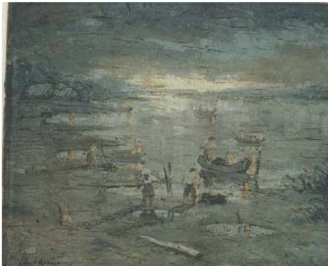
28 Pescadores nocturnos , c. 1960. Óleo sobre lienzo, 52 x 62 cm. Museo de la Nación, Lima

Del mismo estilo es Pescadores Nocturnos donde las formas y el tratamiento del espacio, resuelta a través de ágiles aplicaciones pictóricas en una gama de suaves tonalidades grises, logran que el conjunto transmita la penumbra de la madrugada. El pintor convierte además al tema representado en un pretexto para reproducir el paisaje selvático nocturno.