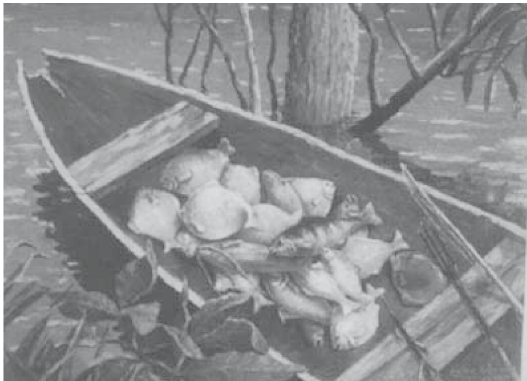
26. Escena de pesca. Óleo sobre lienzo. Fotografía b/n del álbum del artista.

(Ilustración 8, p. 51), resalta la figura erguida de una mujer mestiza en faena cotidiana transportando el agua al hogar, o en la escena de pesca (Ilustración 26) el artista se recrea ejecutando, con la sensibilidad propia del bodegón, los detalles exactos de los pescados que permiten incluso verificar la especie.