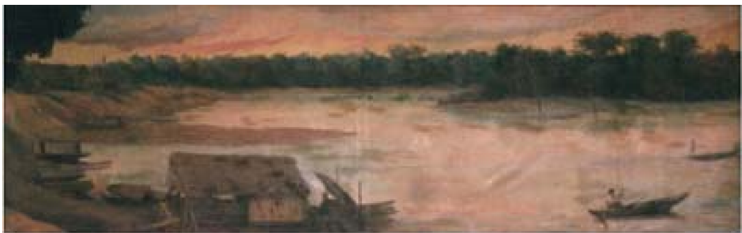
19. Paisaje selvático , c. 1960. Óleo sobre lienzo, 170 x 502 cm. Club Loreto. Lima.

Un tratamiento de factura más cuidada ofrece Vista de Utiquinía 100 donde, además del efecto luminoso, resalta el cuidadoso tratamiento del agua logrado con colores diluidos, que refleja el cielo y los árboles bajo sutiles transparencias. Destacan, además, los elementos propios de la cultura regional como las cabañas y las canoas a la orilla del río. En este cuadro, como en los anteriormente mencionados, predomina el manejo de la luz intensa y cálida.