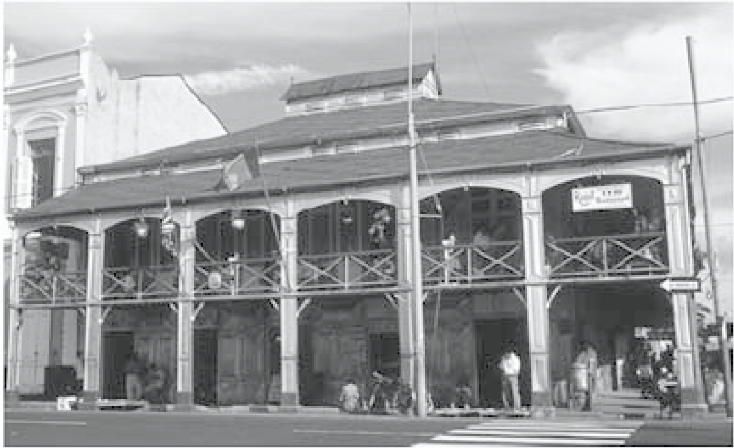
FIGURA N° 2. Casa de Fierro.