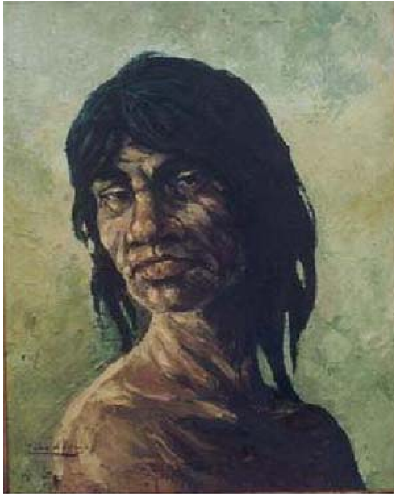
36. Retrato de nativo 3 , c. 1965. Óleo sobre lienzo, 43 x 32 cm. Galería de Arte Vargas, Lima.

Con este grupo de retratos se observa también que Calvo se identifica con los habitantes de la selva amazónica, aquellos con quienes compartió, durante su infancia, largas horas de juego y experiencia artística y, porque no, tal vez fueron sus primeros maestros en las artes plásticas.