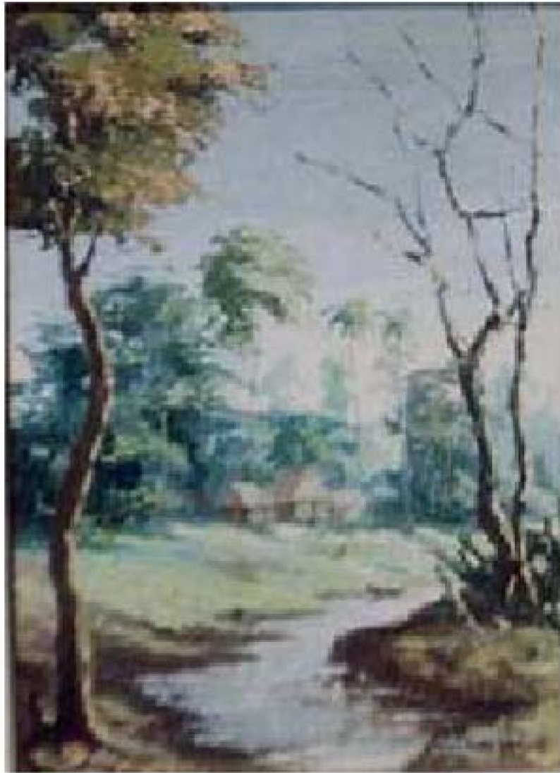
14. Paisaje 1, c. 1959. Óleo sobre lienzo, 50 x 36 cm. Colección privada, Lima.