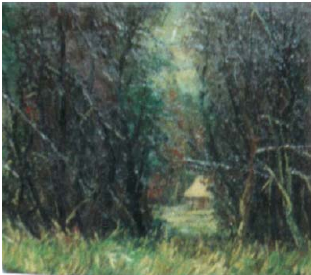
24. Paisaje de Quillabamba, 1960. Óleo sobre lienzo, 55 x 68 cm. Museo de Arte Contemporáneo, Cuzco

entre la vegetación y ofrecen, más que soluciones técnicas y formales, el resultado de su directa comunión con la naturaleza. El primero de los señalados resalta por el esquema estructural definido por la luz que se proyecta hacia el primer plano e ilumina la hierba, de tonalidad verde amarillenta y continua a través del espeso y enmarañado follaje hacia la cabaña ubicada en profundidad.