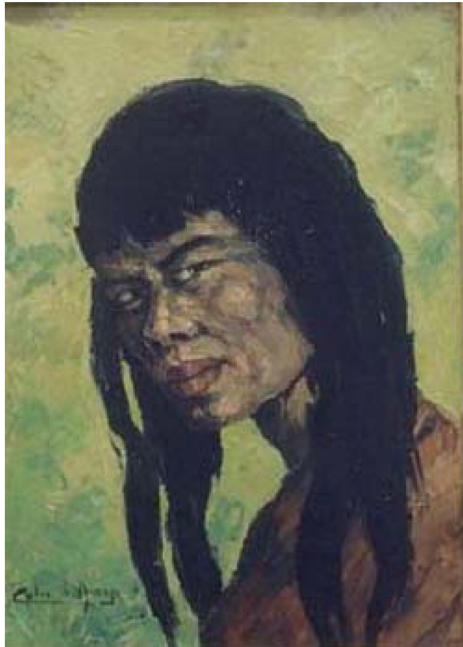
35. Retrato de nativo 2 , c. 1965. Óleo sobre lienzo, 45.5 x 36.5 cm. Galería de Arte Vargas, Lima.