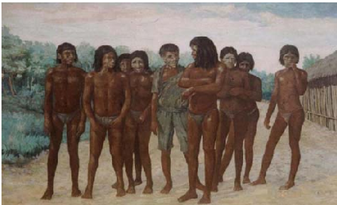
9. Grupo de indios Iquitos , 1953. Óleo sobre lienzo, 248 x 260 cm. Museo Amazónico, Iquitos

para un importante hotel de la ciudad de Iquitos, representa a un grupo de individuos de la comunidad étnica Iquito, que diera nombre a la más próspera capital de la Amazonía peruana. Se ubican frontalmente en el centro de la composición, captados de improviso al modo de una instantánea fotográfica. Entre todos ellos, que lucen escaso atuendo, resalta el que lleva camisa, pantalones y cabello corto; este detalle resulta muy importante para interpretar la obra pues, a través de él el pintor alude a las relaciones entre nativos en proceso de asimilación a la cultura occidental 94 .