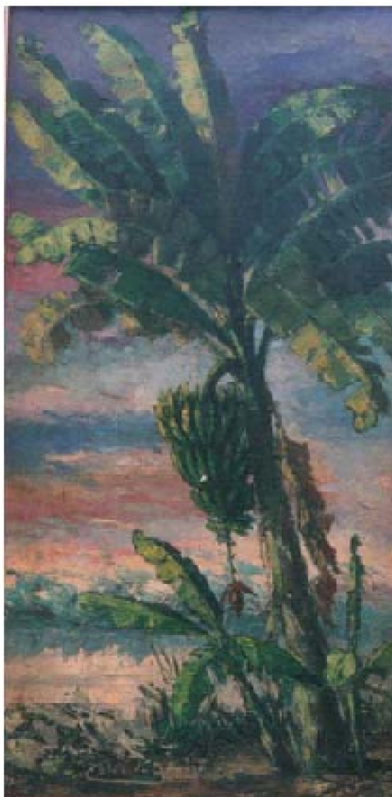
22. Platanal , c. 1959. Óleo sobre lienzo, 80 x 45 cm. Club Loreto, Lima

Árboles cuyos frutos son indispensables en la dieta regional son el objeto principal. La pintura de la ilustración 21 registra la palmera conocida como pijuayo en ella consigue, sin recurrir a la perspectiva, un efecto monumental mediante la oposición masa y luz. Una de las telas mejor logradas de esta serie de árboles es Platanal (Ilustración 22), óleo a la espátula dotado de gran naturalidad, elaborado bajo efectos cambiantes de rico cromatismo de los que participa el fondo. Este especial interés que dedica a los árboles, deteniéndose en detalles de ramas y frutos, se comprende y se complementa con sus ideas sobre proteger y no depredar el bosque gracias a un manejo organizado, cuestión ya planteada en la novela Paiche : "...los árboles tienen mucho valor y debemos aprovecharlos como es debido, de lo contrario, sería como si destruyéramos una casa de concreto para construir en su lugar un tambo de paja" 101 .