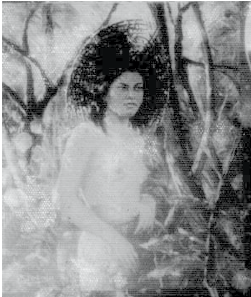
40. Muchacha del sombrero viejo , c. 1959. Óleo sobre lienzo. Fotografía b/n del álbum del artista

Dentro de este grupo, Kamesha es el único desnudo observado directamente en el transcurso del trabajo. Su tratamiento formal y compositivo es similar a los ya mencionados. La luz intensa que ilumina la figura de izquierda a derecha proviene del fondo luminoso de tonalidades verdes que expresa en abstracto la abundante vegetación selvática.