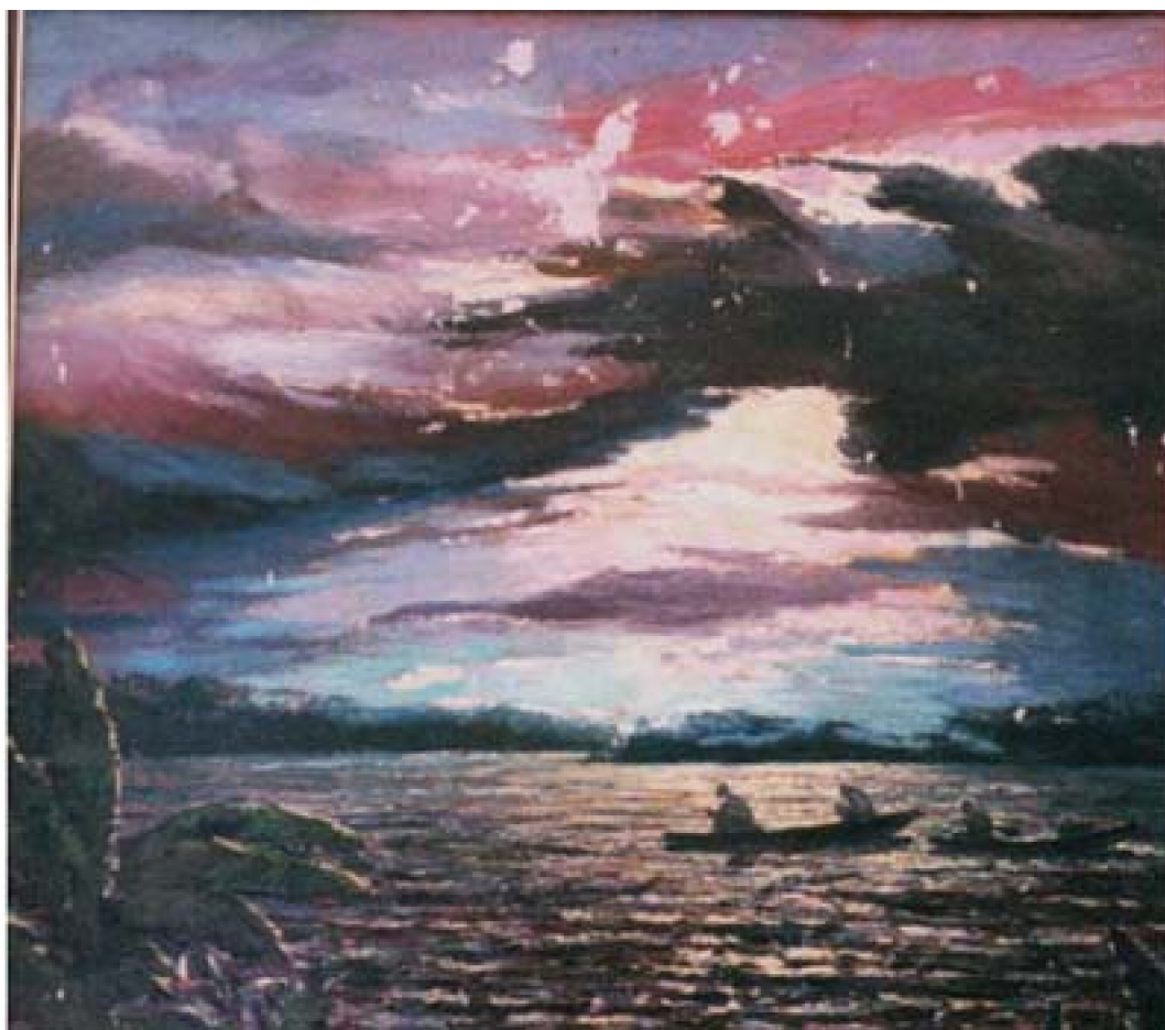
17. Paisaje 3, c. 1960. Óleo sobre lienzo, 90 x 100 cm. Club Loreto, Lima.