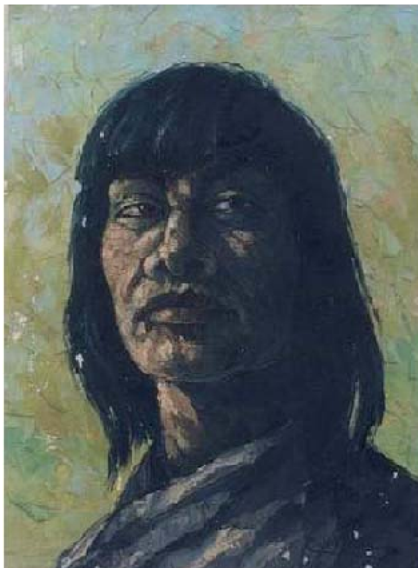
12. Retrato de nativo 1 , c. 1965. Óleo/lienzo, 50 x 40 cm. Galería de Arte Vargas. Lima.

El estudio de cada una de estas etapas revela que la pintura de Calvo de Araujo evoluciona en cuanto al tratamiento técnico que va de un delicado trazo de pincel, estructuras simples, colorido tenue y línea marcada hacia estructuras compositivas complejas de intenso colorido donde las formas son dadas por ágiles aplicaciones de espátula, excepto en los retratos de salón que mantienen el mismo tratamiento. Lo que no varía y es constante en cada período, son los asuntos y motivos principales de sus composiciones siempre dedicadas a describir el mundo amazónico.