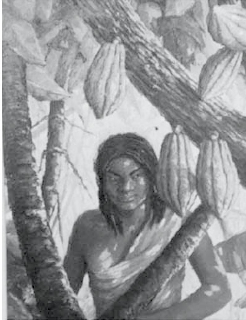
38. Cacao , c. 1961. Óleo sobre lienzo.

imagen femenina es objeto de múltiples realizaciones.