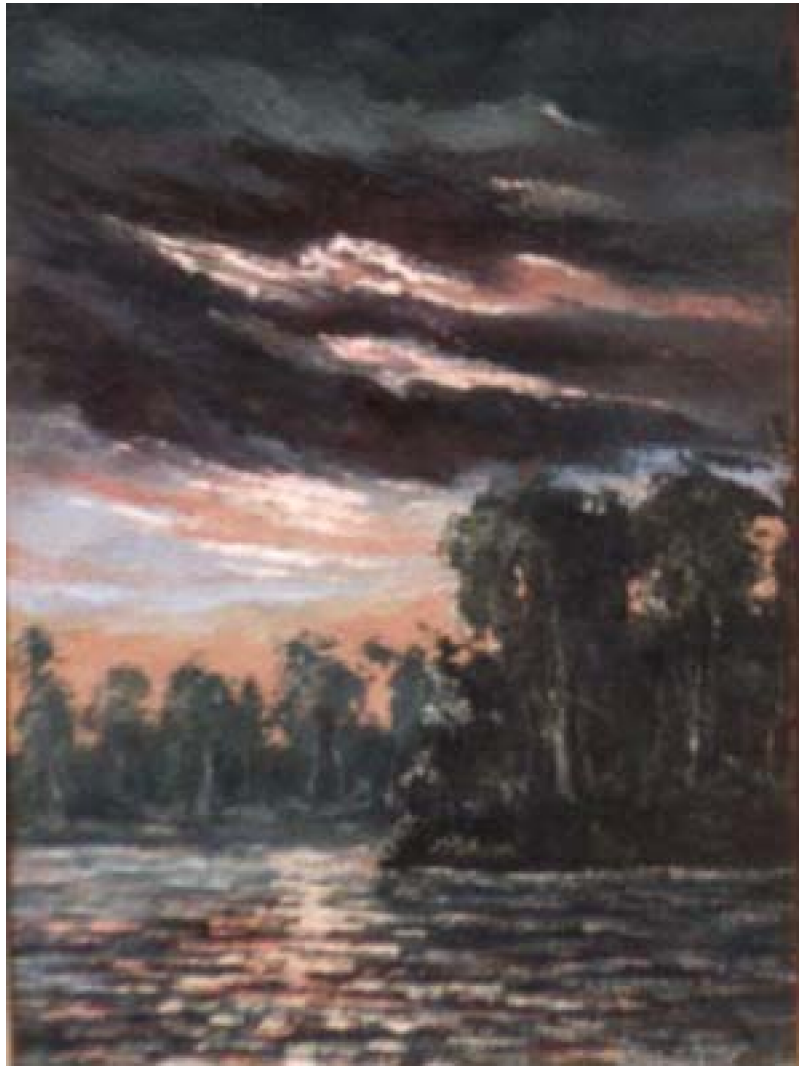
16. Paisaje 2 , c. 1959. Óleo sobre lienzo, 35 x 49 cm. Colección privada, Lima.

En otra serie de paisajes da preferencia a los celajes de vibrantes colores realizados con soltura impresionista. En el Paisaje 2 , de factura dinámica y trazo vigoroso, el cielo, elemento con más peso visual, es dividido en dos planos; en el más próximo resalta el agitado movimiento de cargadas nubes que obstruyen el paso de la luz, oscurecen el espacio y anuncian tormenta; el plano del fondo capta nítidamente el efecto luminoso del paisaje tropical. En la ilustración 17 persiste en el ocaso y las penumbras donde el tratamiento del cielo, en base a manchas en una mixtura de cálidos y fríos, recrea el característico tono violáceo de los atardeceres amazónicos.