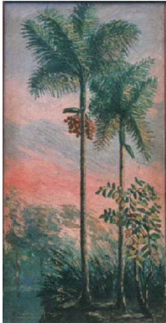
21. Pijoayos , c. 1959. Óleo sobre lienzo, 80 x 45 cm. Club Loreto, Lima.