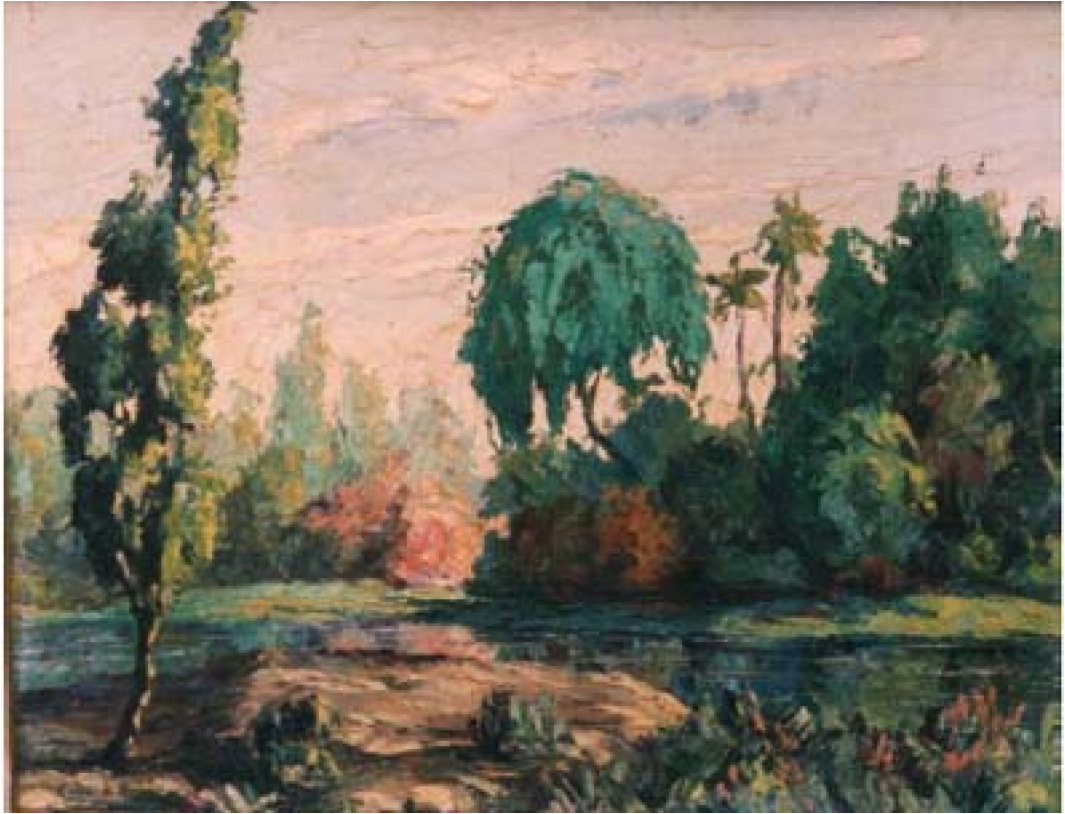
11. Paisaje selvático, c. 1966. Óleo/lienzo, 48 x 59 cm. Colección privada, Lima

formas facetadas del cuerpo y rostro de elevada cuota estética.