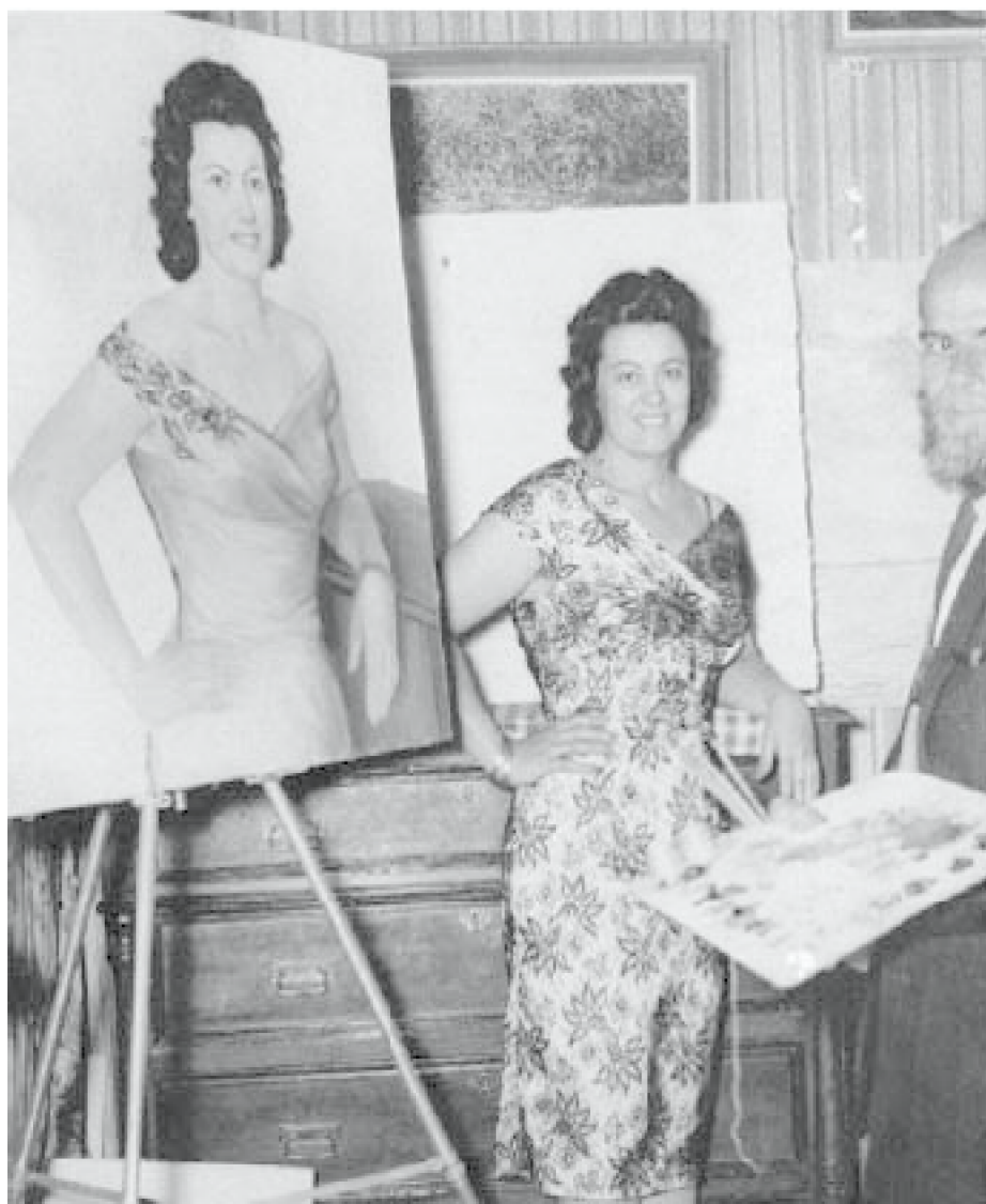
César Calvo retratando a mujer c. 1960. Fotografía b/n del álbum del artista.