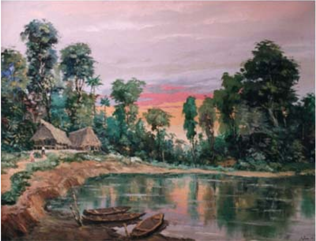
18. Vista de Utiquinía , c. 1962. Óleo sobre lienzo, 77 x 100 cm. Colección privada, Iquitos.

Un tratamiento de factura más cuidada ofrece Vista de Utiquinía 100 donde, además del efecto luminoso, resalta el cuidadoso tratamiento del agua logrado con colores diluidos, que refleja el cielo y los árboles bajo sutiles transparencias. Destacan, además, los elementos propios de la cultura regional como las cabañas y las canoas a la orilla del río. En este cuadro, como en los anteriormente mencionados, predomina el manejo de la luz intensa y cálida.