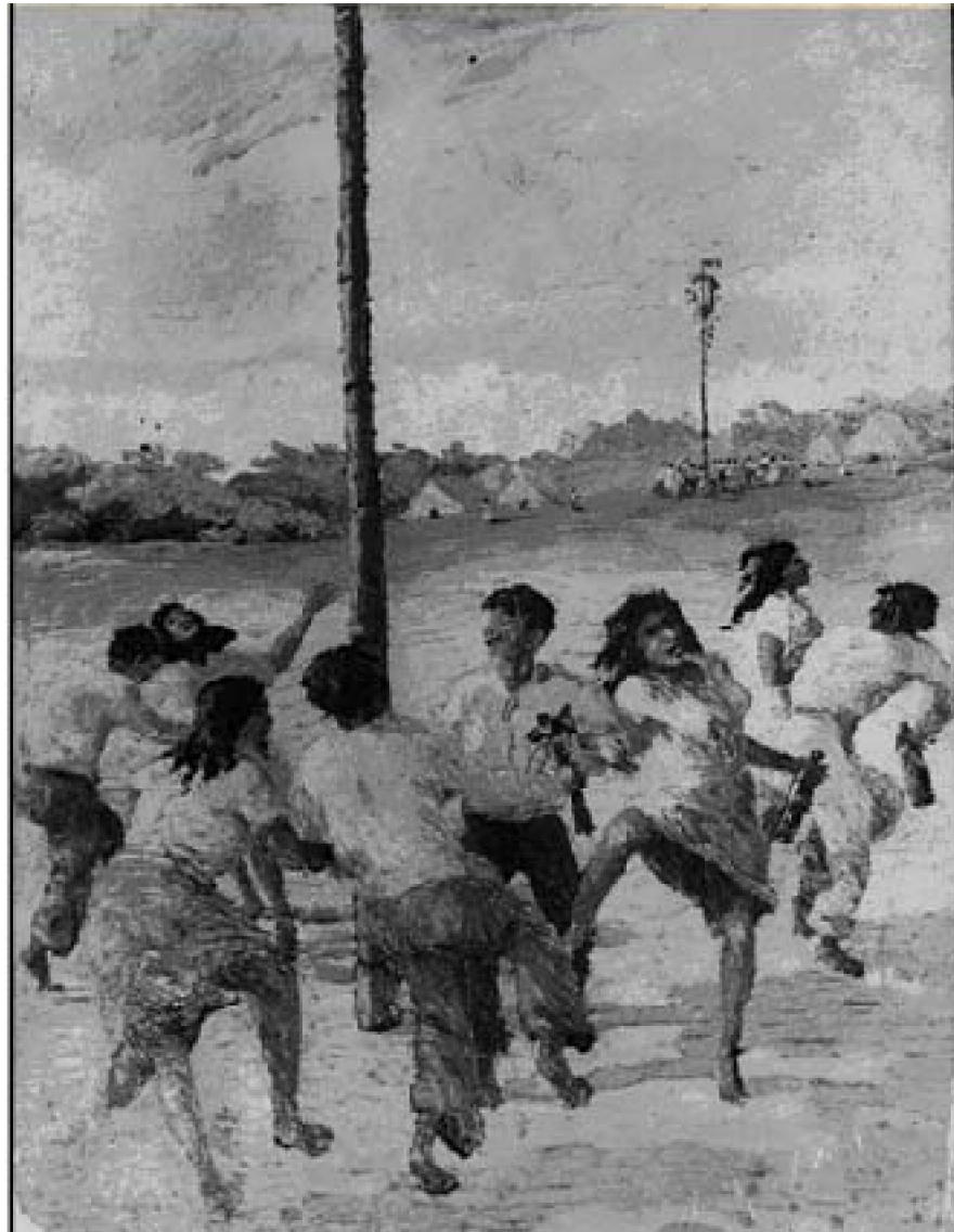
27. Changanacuy, c. 1949. Óleo sobre lienzo. Fotografía b/n del álbum del artista.