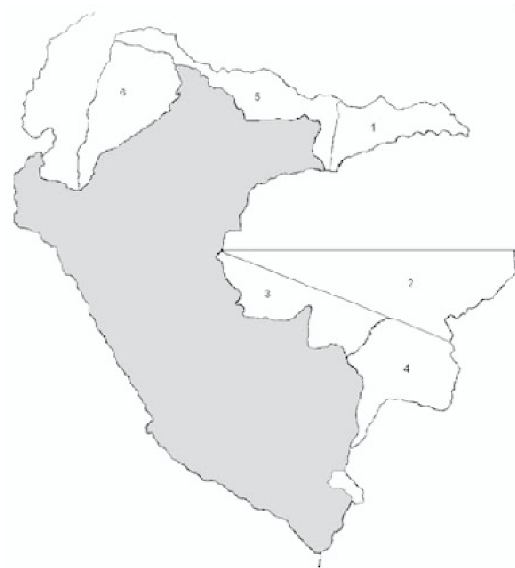
FIGURA Nº 4. Territorio cedido a países vecinos. Tomado de Morey y Sotil

6- Protocolo de Río de Janeiro (Perú-Ecuador). En 1942, Perú entregó 110,794 km 2 después del enfrentamiento con Ecuador.