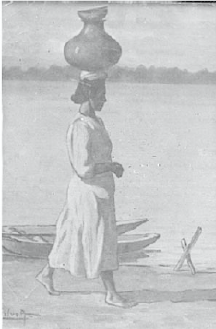
8. Por agua , c. 1946. Óleo/lienzo.