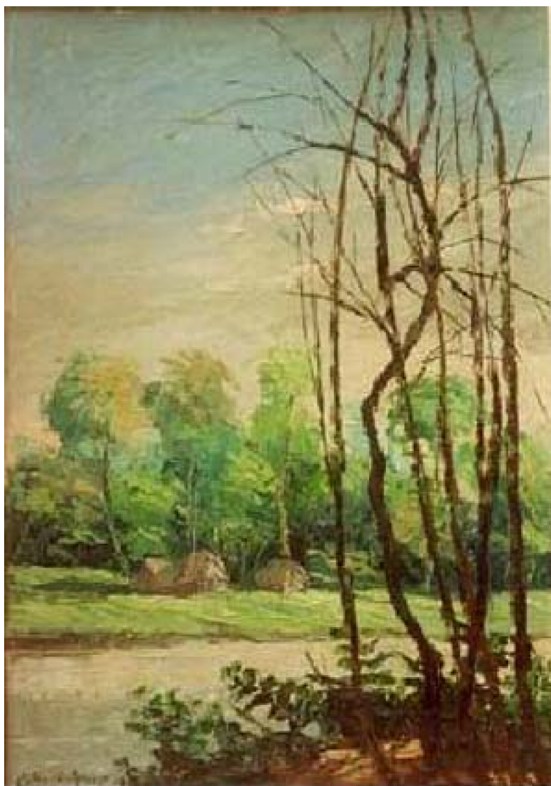
15. Paisaje, Pucallpa, c. 1965. Óleo sobre madera, 49 x 35 cm. Colección privada, Lima.