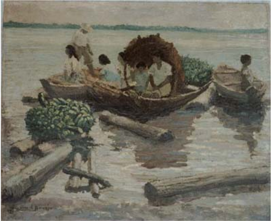
29. Rematistas de Belén , c. 1958. Óleo sobre lienzo sobre nordex, 61 x 71 cm. Museo de la Nación, Lima.

Rematistas de Belén corresponde también al período de madurez; traduce una típica escena del puerto de la ciudad a donde arriban las embarcaciones procedentes del interior de la selva con productos para comercializar. La estructura compositiva de horizonte elevado resalta la actividad que acontece en pleno río: comerciantes y campesinos intercambian alimentos básicos de la dieta regional como el racimo de plátanos ubicado sobre los troncos que flotan en el agua.