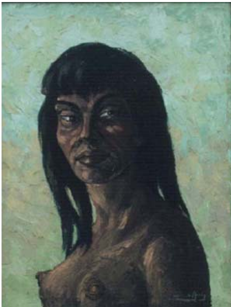
41. Kamesha , c. 1965. Óleo sobre lienzo, 48 x 37 cm. Galería de Arte Vargas, Lima