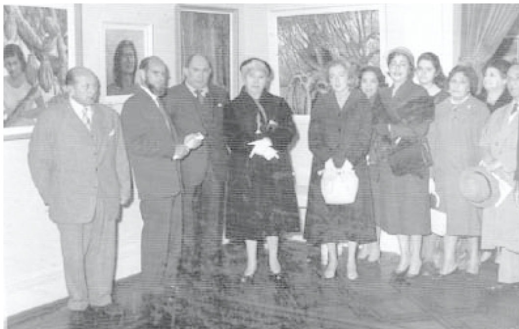
Inauguración, c. 1959.