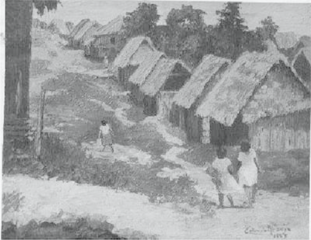
23. Barrio pobre , 1959. Óleo sobre lienzo.

Abocado a la defensa de la naturaleza, el paisaje urbano no es objeto de su interés. Ningún ejemplo de la ciudad ilustra sus composiciones; en su lugar prefiere las zonas urbanas marginales como el puerto de Belén de Iquitos y pequeños poblados de casas rústicas. En Barrio pobre 102 el tratamiento técnico y la concepción del espacio sufren cambios respecto a anteriores obras, alcanzando un estilo particular, sobresale la estructura dominada por la diagonal que cruza el cuadro de un extremo a otro y el ágil tratamiento de la espátula. Constituye, frente a Vista de Utiquinía , un cambio en la estructura compositiva y en la factura formal hacia una visión impresionista, sin desnaturalizar su esencia realista.