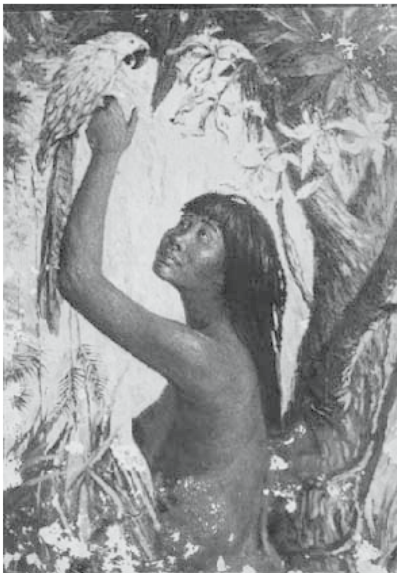
39. Muchacha amazónica. , c. 1959. Fotografía b/n del álbum del pintor