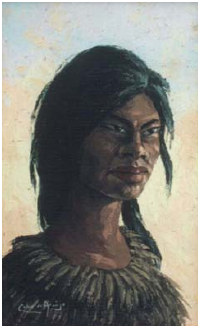
37. Towe , c. 1965. Óleo sobre lienzo, 51 x 33 cm. Galería de Arte Vargas, Lima.

Towe es el único que ubicamos con título. Agrupa varias de las características señaladas pero esta vez el contraluz, que proviene del fondo y que permite resaltar la figura, es más pronunciado.